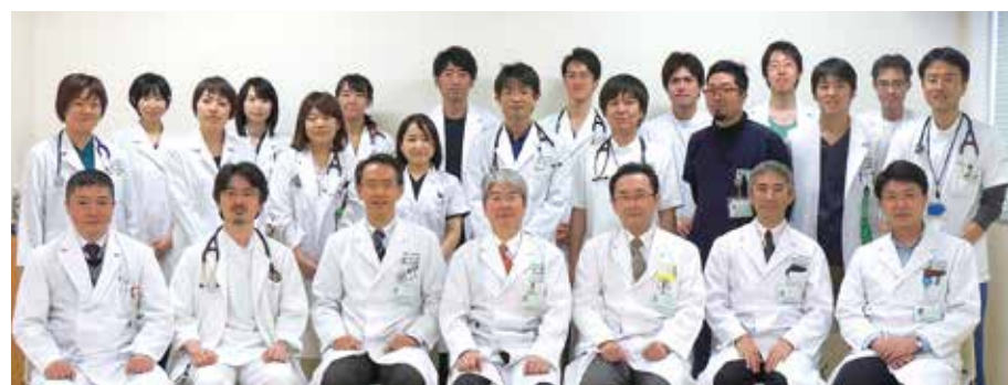
第一内科のメンバー

外来においては症例数の少ない稀少性肺疾患は治療法が確立していないこともあり、山形県においては当院で診療を行う機会が多いかと思えます。さらに当院外来における外来診療の特徴の一つ挙げますと、ほぼ全てのCOPD患者で全呼吸器内科医師によって、きめ細かい定期的なフォローを画一的に行っていることです。COPDは当呼吸器内科での診療・研究のメインターゲットと考えておりますので、是非ご紹介いただければと思います。きめ細かい病診連携を行って参ります。